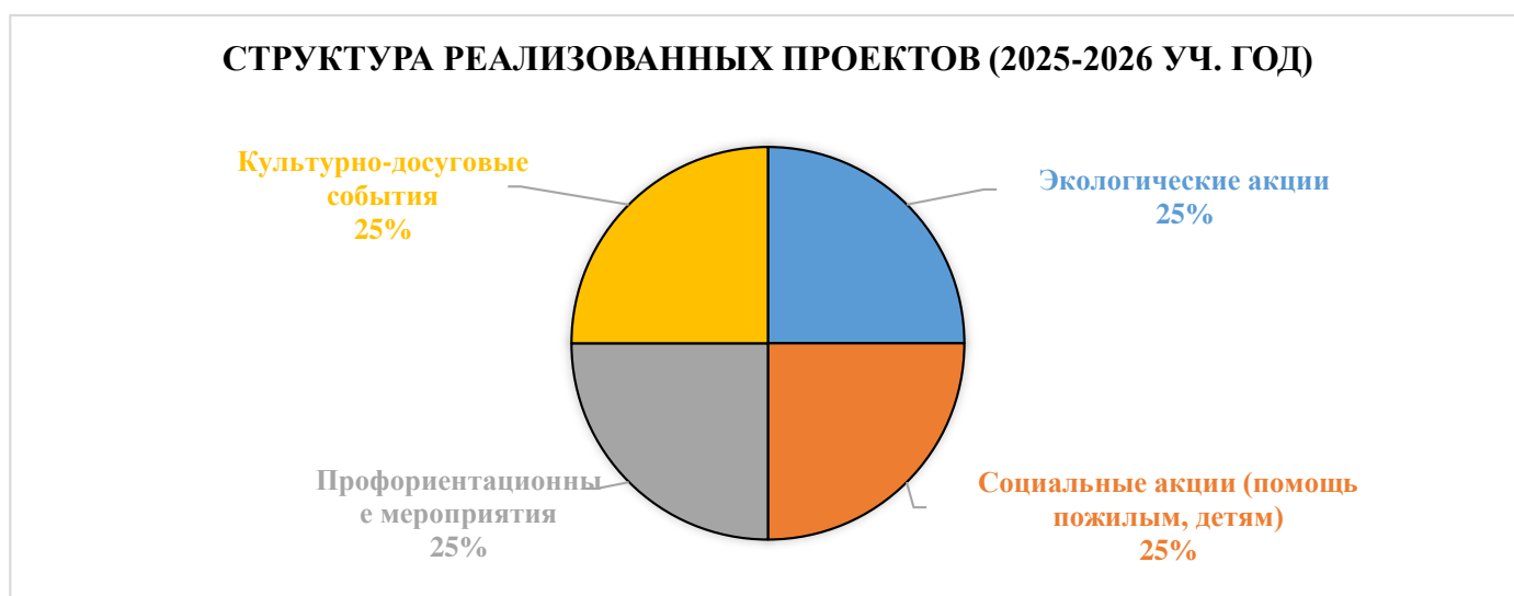
Диаграмма 1. Структура реализованных проектов (2025-2026 уч. год)

Разнообразие тематики проектов показывает широту интересов учащихся и их способность применять лидерские навыки в различных сферах жизни школы и местного сообщества.